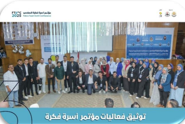
توثيق فعاليات مؤتمر أسرة فكرة