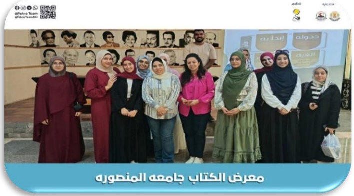
معرض الكتاب جامعه المنصوره