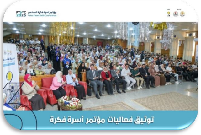
توثيق فعاليات مؤتمر أسرة فكرة