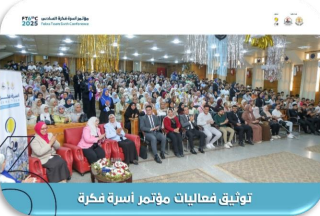
توثيق فعاليات مؤتمر أسرة فكرة