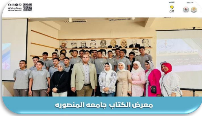
معرض الكتاب جامعه المنصوره