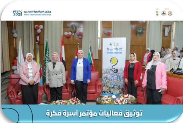
توثيق فعاليات مؤتمر أسرة فكرة