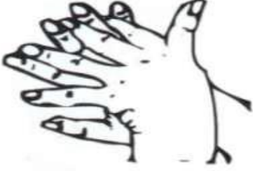
٢- راحة اليد اليمنى على ظهر اليد اليسرى راحة اليد اليسرى على ظهر اليد اليمنى.