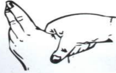
٥- الدعك الدائري (الحك المتعاقب) للابهام الايمن في قبضة راحة اليد وبالعكس.