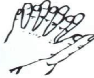
٣- أصابع اليد المتشابكة