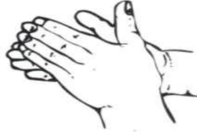
١- راحة اليد الى راحة اليد.