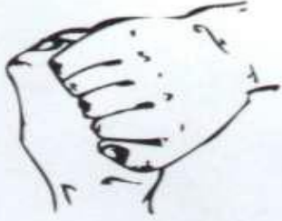
٤- ظهر أصابع الراحة المتقابلة اليد المقابلة مع تشابك الاصابع