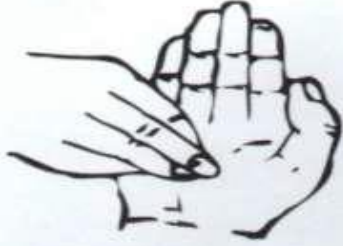
٦- الاحتكاك الدائري للخلف والامام للاصابع متشابكة لليد اليمنى في راحة اليد اليسرى وبالعكس